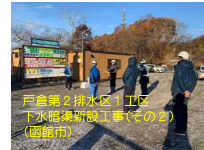
戸倉第2排水区1工区 下水暗渠新設工事(その2) (函館市)