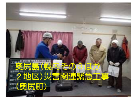
奥尻島(幌内そのほか) 2地区)災害関連緊急工事 (奥尻町)