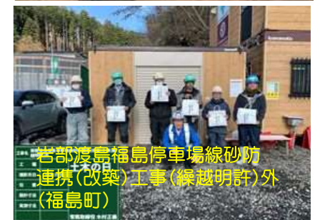
若部渡島福島停車場線砂防 連携(改築)工事(深越明許)外 (福島町)