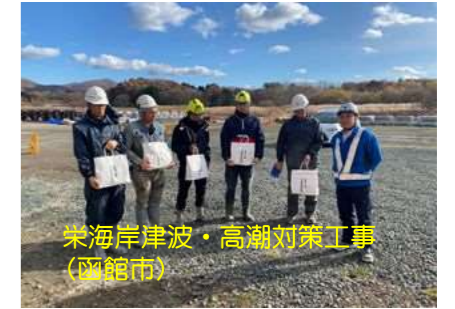
栄海岸津波・高潮対策工事 (函館市)