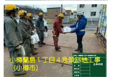
小樽蘭島1丁目4急傾斜地工事 (小樽市)