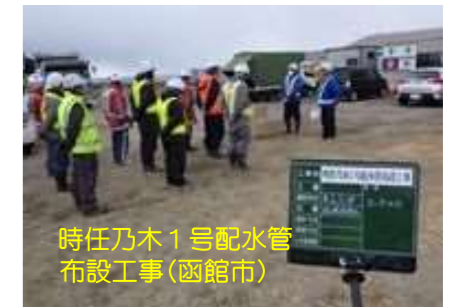
時任乃木1号配水管 布設工事(函館市)