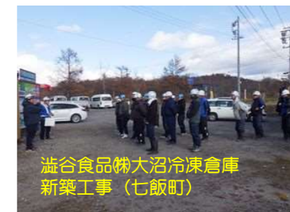
溢谷食品(株)大沼冷凍倉庫 新築工事 (七飯町)