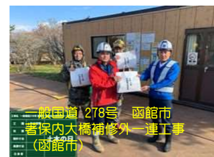
一般国道278号 函館市 若保内大橋補修外一連工事 (函館市)