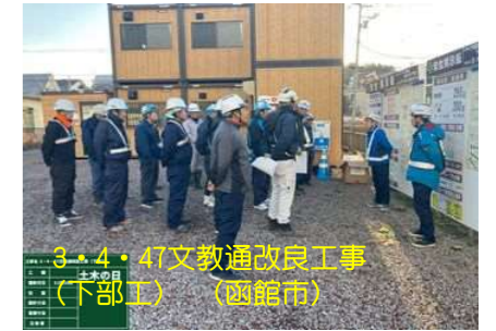
3・4・47文教通改良工事(下部工) (函館市)