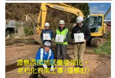
渡島西部地区機能強化・老朽化対策工事(福島町)